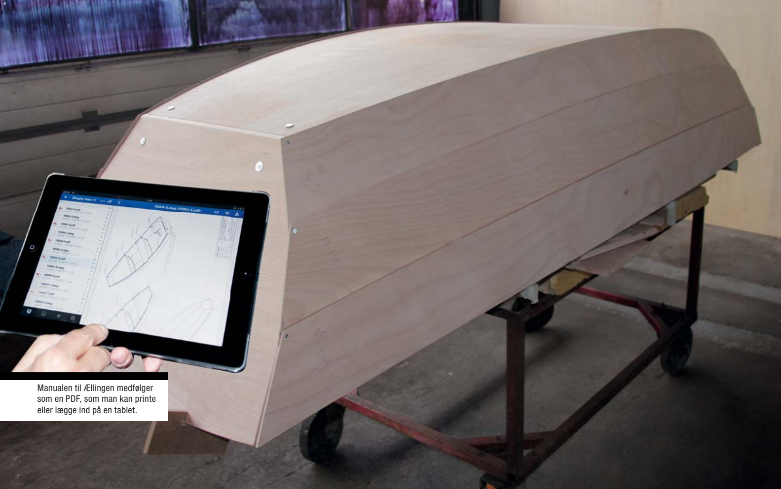
Manualen til Ællingen medfølger som en PDF, som man kan printe eller lægge ind på en tablet.