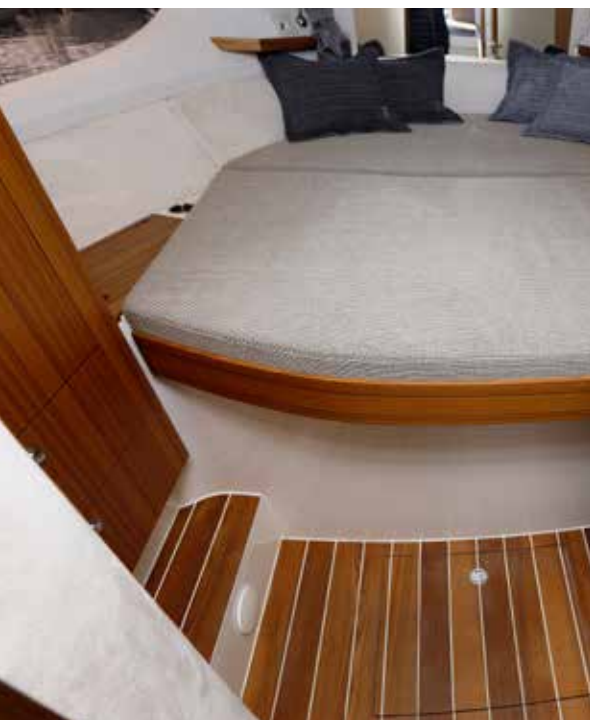
Ejerkahytten under fordækket med stor dobbeltkøje og garderobeskabe, der ses til venstre i billedet. Døren er med hærdet, brudsikkert og splintfri matteret glas.