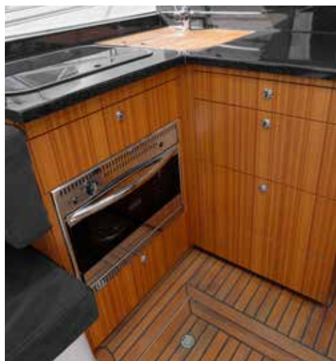
Pantryet om bagbord er L-formet med gasblus, indbygget ovn og skuffer til køkkengrejet. Dobbeltvasken er indstøbt i pantrybordet, og er her dækket af store spækbrætter.