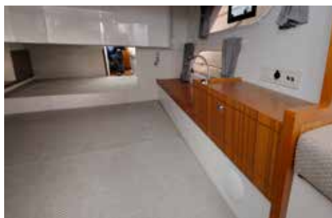
Gæstekahytten er med stor tværskibs dobbeltkøje. Der er ståhøjde indenfor døren.