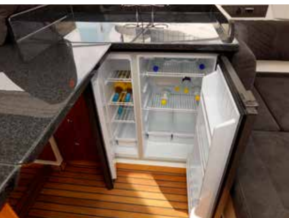
Bådens store køleskab er placeret bag pilotsædet. Klapbordet midtskibs gør pantryet kæmpestort.