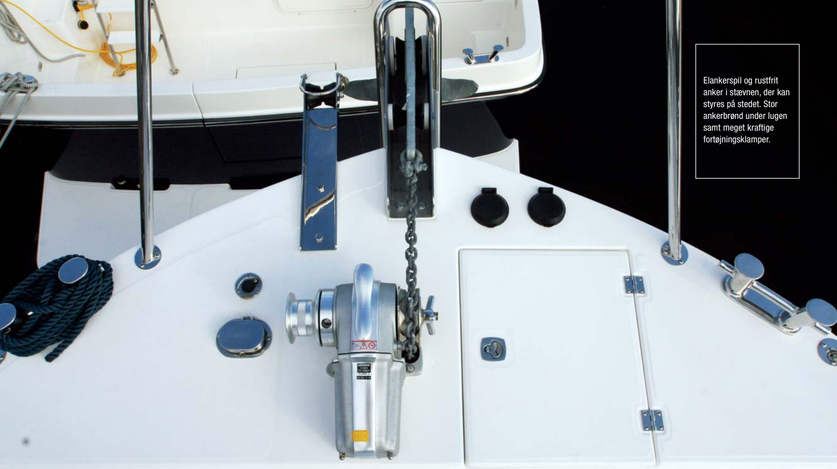
Elankerspil og rustfrit anker i stævnen, der kan styres på stedet. Stor ankerbrønd under lugen samt meget kraftige fortojningsklamper.

skinne og en stor ankerbrønd til tov og grej. Kraftige fortojningsklamper til solidt tovværk er en selvfølge. Samme type klamper midtskibs og agter. På dæksalonnens ruf med den "falske" skorsten, (tug look a like), er der en flot designet mast med radar, lanterner og antenner. Masten er monteret så den kan sænkes f.eks. ved sejlads under broer. På taget findes også en kraftig projektor til sejlads i mørke. Vi gør også opmærksom på at der er skridsikre flader på dæk og badeplatform.