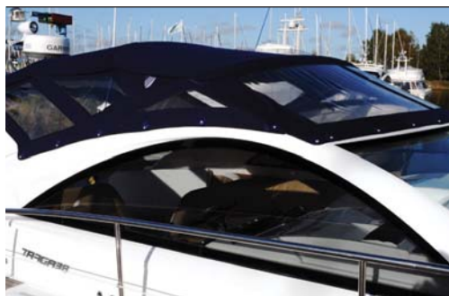
Kalecheløsningen på Fairline Targa 38 er todelt pga. targa-bøjlen. Men den er nem at montere og tage ned igen.